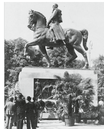
7. Lojze Dolinar, Herman Hus: Spomenik kralju Aleksandru I., 1940, Ljubljana, uničen (fotografija iz leta 1940)

Ujedinitelj: Spomenik kralju Aleksandru u Ljubljani