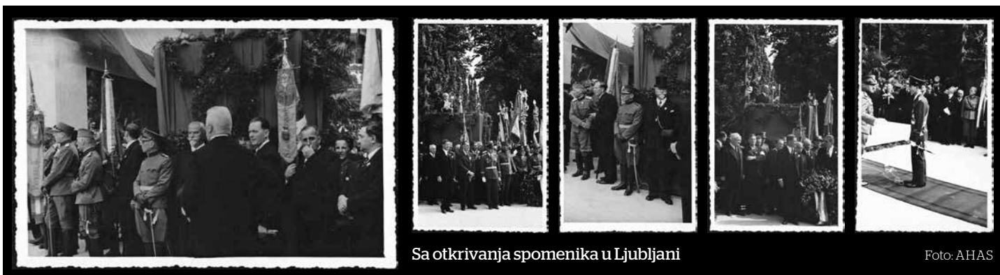
Sa otkrivanja spomenika u Ljubljani