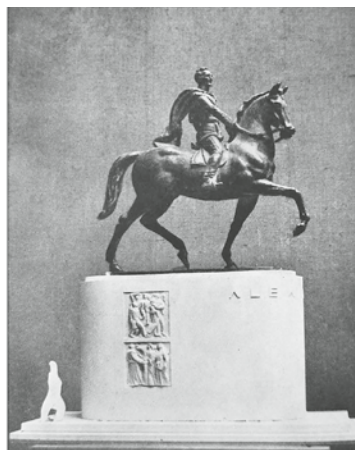
6. Lojze Dolinar: Osnutek za spomenik kralju Aleksandru I. v Ljubljani, nahajališče neznan

Smatrajući da će predložena veličanstvena i monumentalna građevina ostati "mrtva", zalagali su se za očuvanje živog sećanja na pokojnog vladara. Slovenija nema ni zlato ni srebro, ni najlepšu bronzu ili mermer koji bi mogli da izraze ono