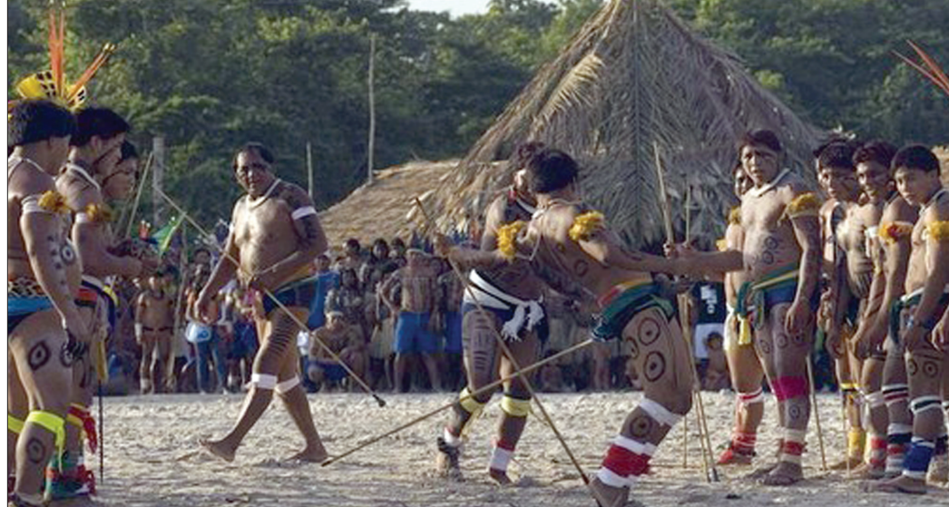
BRAZIL PLEME: Treba posmatrati kontrolu moći

Po Majklu Hartu i Antoniju Negriju, ti preobražaji za posledicu imaju pojavu novog oblika suvereniteta: Imperi-