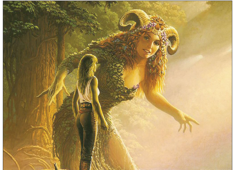
Demetra i Persefona: Doba cvetanja i plodnosti

U genijalnoj komediji Arsenik i stare čipke američkog pisca Džozefa Keselringa iz 1939. (adaptiranoj u isto tako genijalnom filmu Frenka Kapre 1944., sa Kerijem Grantom), dve lude stare tetice